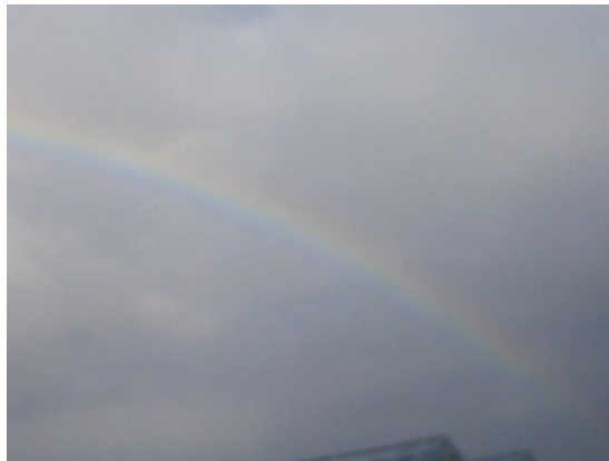
IJslandreis maart 2016@sterrenpoort

Overall ter wereld kan je haar beeltenis tegenkomen, ook in de westerse wereld. Echter in Azië zie je haar werkelijk in bijna ieder huis, tempel, klooster op een altaartje staan en zelfs bovenop hoge bergen hebben ze een plekje voor haar ingericht. Ook vertoont ze zich steeds vaker als een volledig overkoepelende regenboog over Moeder Aarde heen om te waken over de hereniging tussen oost en west.