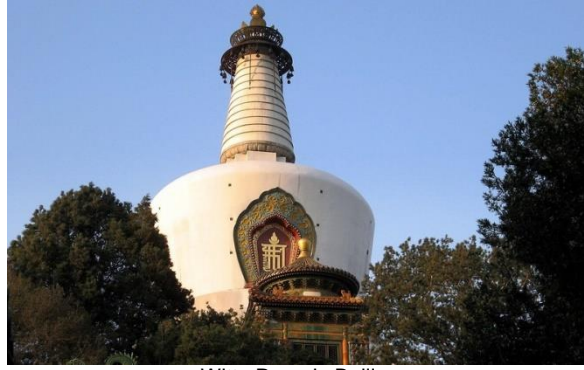
Witte Pagode Beijing