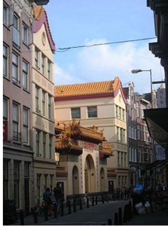
He Hua tempel in Amsterdam