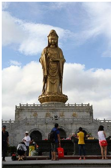
Beeld van Moedergodin Kwan Yin op eilandje Mount Putuo Shan in de South Sea.

Volgens traditionele overleveringen heeft Kwan Yin geleefd op het eiland Putuo Shan (Pu To Shan). Ze trok zich daar terug en hield zich schuil van het alledaagse leven. Sinds de elfde eeuw wordt hier Kwan Yin vereerd.