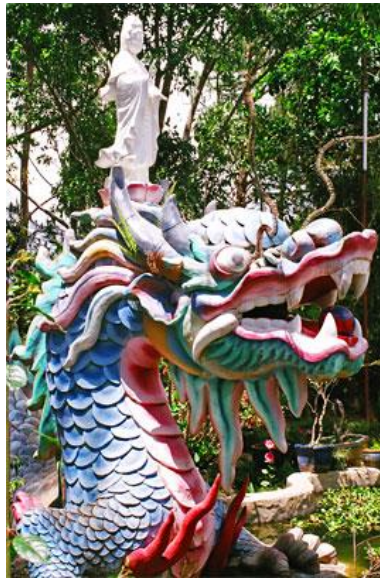
Kwan Yin staande op een draak.

Kwan Yin zie je in China tijdens ceremonies op een draak staan. Dit staat symbool voor haar hoge aanzien als een godin van wijsheid en goddelijke oerkracht van transformatie. Al in vroeger tijden betekende de 'draak' dat men te maken had met iemand van hoog spiritueel aanzien, een hoge graad van wijsheid, een leven scheppende oerkracht en een magische beschermer die zijn weerga niet kent. Een draak staat dus voor de oorsprong & oer-energie vanuit de vader/moeder Bron.